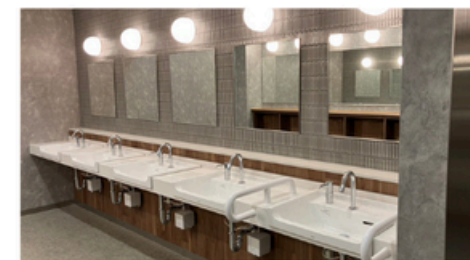
豪華に改修されたトイレ