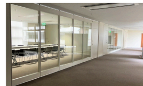
新たに整備された会議室