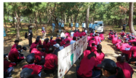
津中2年生による清掃活動 (R8.6.10)