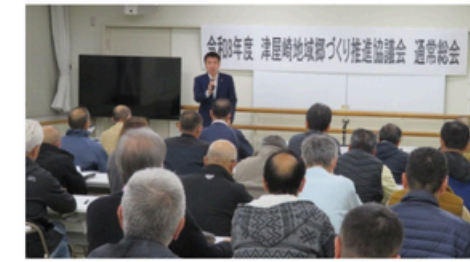
福井市長来賓あいさつ

郷づくりが発足して、今年4月で19年になりました。安心安全で、快適で、笑顔の絶えない地域を目指し活動を続けています。 本年度も本紙表紙に掲載している事業計画を実施する予定にしています。本紙等で、いっしょに活動していただけるボランティアの方を募集していますが、まだ、まだ、人が足りていません。まずは気軽に郷づくり事務所遊びに来ませんか。いっしょに楽しく活動できればと思います。特に、これからの地域を担う若い人達の参加に期待をしています。 本年度もよろしく願います。