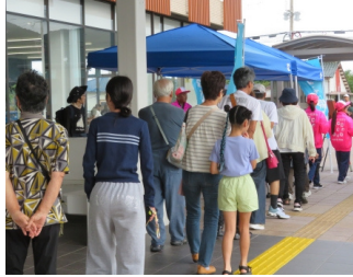
福津産品おもてなし（カメラ図書館前）