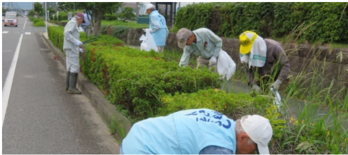
コース清掃（つばき通り付近）

第11回プリンセス駅伝の開催にあたり、今年も、当日、福津市文化会館前が、大勢の応援者が集まる第4中継所となることから、津屋崎の鯛モナカ、モマクッキー、ハロウィンクッキーをカメラリア図書館前や中継所付近の歩道で配りました。また、前日には、コース上のゴミ拾いをJA宗像津屋崎支店・津屋崎郵便局・地域の方々と協力して行いました。来年も多くの方が応援に来ていただければ、心からお待ちしています。