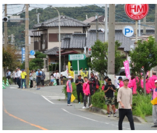
選手応援（第4中継所付近）