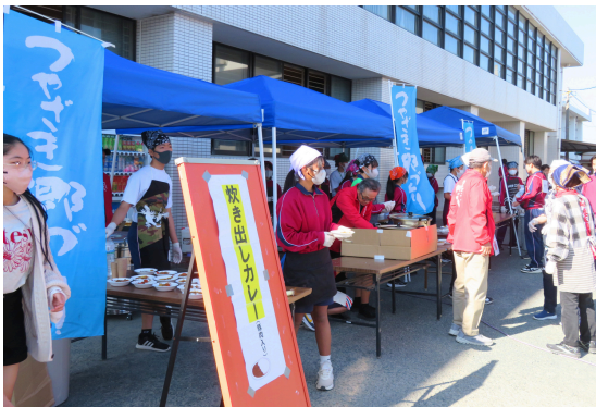
防災カレーの炊き出し訓練

地域の防災意識の向上の機会として、津波の日（11月5日）の直後の土曜日に毎年実施している訓練です。各自治会で取り組む必須訓練として、まず、自分と家族の身の安全を守り、次に、避難経路を確認し、一次避難所に避難する訓練を各自治会で取り組む必須訓練として行いました。郷づくりでは、小・中学校とも連携して津中において、任意訓練を行いました。今年初めて炊き出し訓練としてカレーを作りました。参加者に試食として提供しました。みんな「おいしい」と大変好評でした。今回の大雨災害も教訓として、日頃から家庭や地域でできる対策について、地域みんなで考えていきたいと思います。