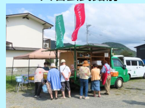
東町1区分別収集会場

市の事業として、グリーンコープの「元気カー」が買物に行きたくても行けない方を支援するとともに、見守りの役割も担って実施されました。今後は12月5日(金)から毎週金曜日に開催することが決まりました。