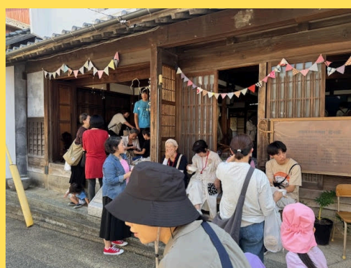
手づくり市 10月12日(日)

晴天に恵まれ、たくさんのお客様が手づくりされた品物を手に取って見たり、購入したりして楽しんでいました。