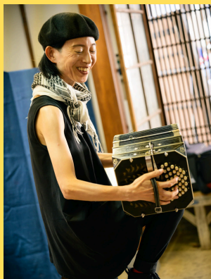
音楽散歩 10月13日(月祝)

晴天に恵まれ、たくさんのお客様が手づくりされた品物を手に取って見たり、購入したりして楽しんでいました。