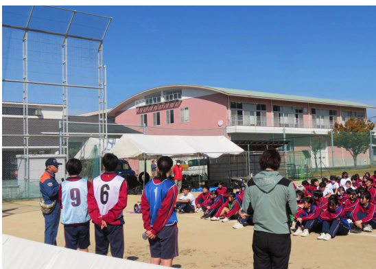
閉会行事（福津消防署講評）