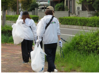
コース清掃（しおさい通り付近）