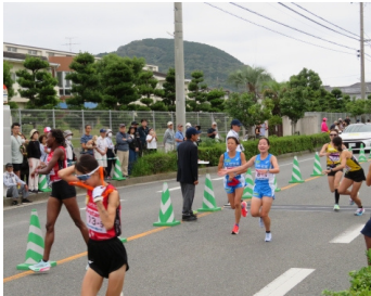
第4中継所のタスキ渡し