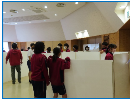
間仕切りの組み立ての練習です