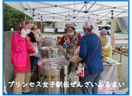
プリンセス女子駅伝ぜんざいふるまい