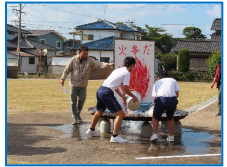
地域別にバケツリレーのタイムを計りました。盛り上がりました！

コミセン文化祭・プリンセス女子駅伝ぜんざいふるまい・郷育カレッジ・稲刈り体験教室・芋ほり体験教室を実施しました！ HPでご確認下さい！