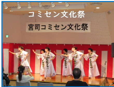
コミセン文化祭 宮司コミセン文化祭