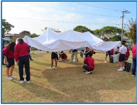
テントの組み立ての練習です