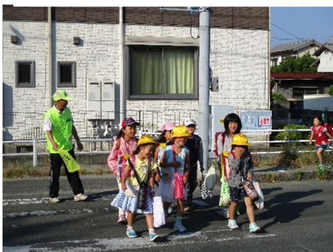
横断を誘導する見守り隊の様子