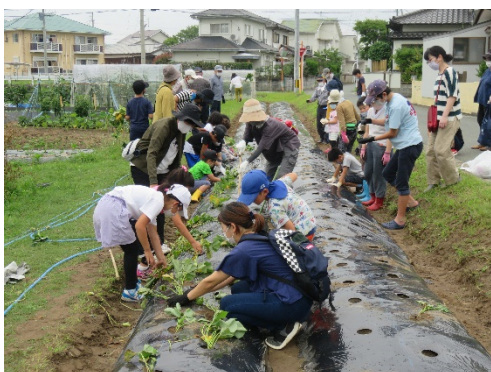
子育て支援部会 芋苗植え時の様子

私は朝 7 時から 8 時までの岡の交差点で見守りをしています。登校の様子を見てみると、早い子は、ほとんど駆け足で、遅い子は 8 時頃にマイペースで慌てずに通学します。その子の性格がよく表れているなど感じますね。4 月に新一年生が重いランドセルを背負って足元も覚束なく通学しますが、夏休み明けにはしっかりと歩く姿を見て成長の早さに感動します。見守っているというより子ども達から元気を貰って、孫が大勢いる気分で元気に活動できています。