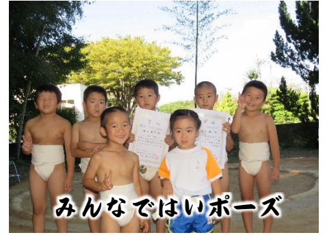
みんなではいポーズ