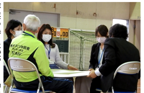
《大人の神興東地域を語る会》

が続きました。地域で何かできることはないのかと考えるようになりました。そのようなとき、小学校での九月の校地美化