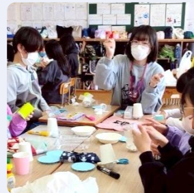
スタンドグラス風コースターと起き上がりこぼし