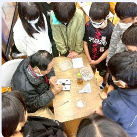
昆虫の標本をつくろう