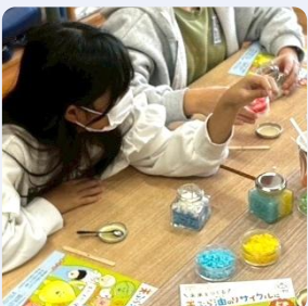
使用済み食用油をつかったオリジナルカラフルエコキャンドル