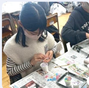
キャンドルづくり