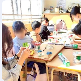
クリスマススノードームづくり