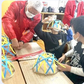
クラフトテープでスタードーム