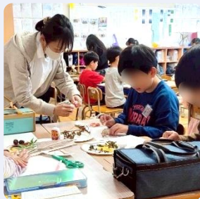
自然の物を使ってコラージュ