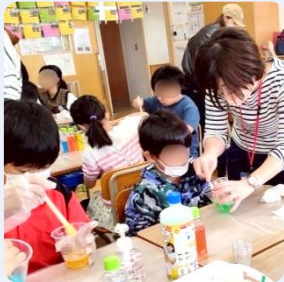
スライムをつくらう