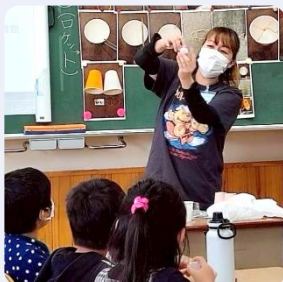
紙コップで工作しよう