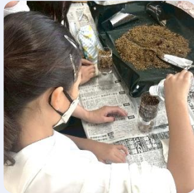
世界一ちっちゃなわたしの菜園