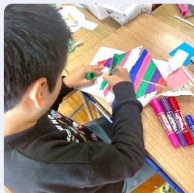
かざぐるまを作ってあそぼう