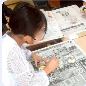
スノードームづくり