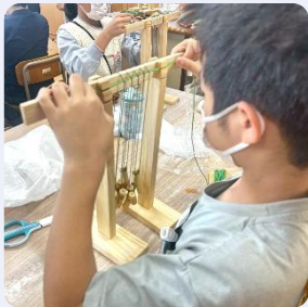
アングン編みでコースター