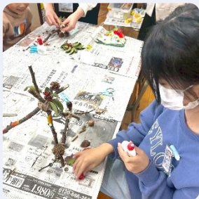
ネイチャークラフト