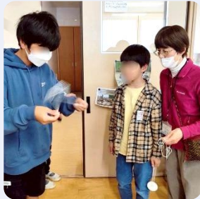
びゅんびゅんごまづくり