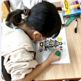
スタンドグラス風写真立て