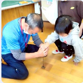
たから箱を作ろう