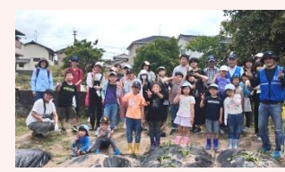
昭和区福祉会 昭和区、西福間1子ども会と合同でさつまいもの苗植え