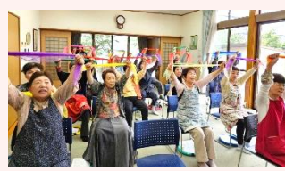
本町区福祉会 音楽療育講師による音楽活動教室