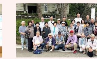
大和二区大寿会 日帰り研修旅行で国史跡「福岡城・鴻臚館」へ