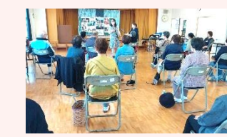
西福間1福祉会 ヤマハ音楽教室による認知症予防講座