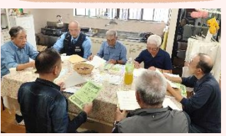
花見総区 福間交番の入住巡查部長と安全対策について情報交換

感染症対策を行いながら、郷づくりの会の各部会や自治会、小地域福祉会、子ども会などが活動しています。