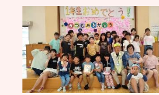
花見2区子ども会 新入生歓迎会と見守り隊のみなさんとの交流会