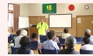
緑町区福祉会 高齢者の護身術