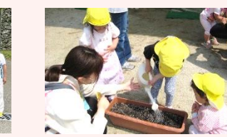
人権擁護委員 すわ保育園にて「人権の花運動」ヒマワリの種まき