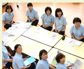
私たちも地域のために協力します! (双葉保育園のみなさん)

【その他】参加事業所及び団体については、郷づくりニュースに掲載します。(掲載希望の事業所及び団体のみ)