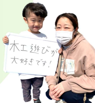
おおほりしおんさんとお母さん