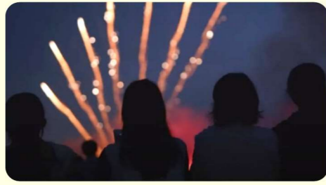
「福間バンパク」は、「バン（花火）」、「パク（食べること）」から。卒業おめでとう！