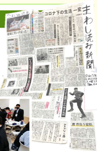
完成した「まわし読み新聞」