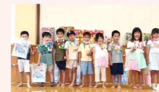
花見2区子ども会 新一年生歓迎会