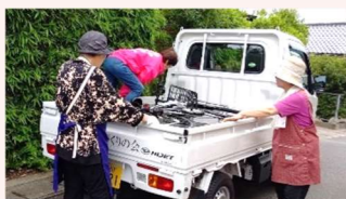
本町区福祉会 廃品収集と廃品回収

感染症対策を行いながら、郷づくりの会の各部会や自治会、福祉会、子ども会などが活動を再開しています。