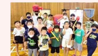
福間小校区 宮司子ども会 歓迎レクリエーション