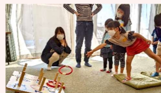
本町区すみれ子ども会 新一年生歓迎会