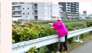
福津市地域婦人会 あじさいロードの花がら摘み