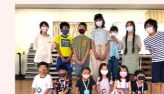
大和2区子ども会 新一年生歓迎会