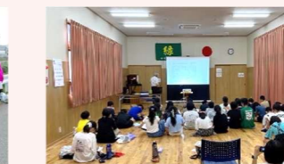
福間小6年生 総合学習