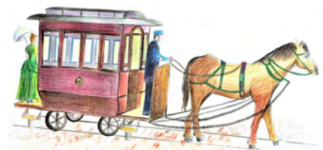
中学生が描いた馬車鉄道