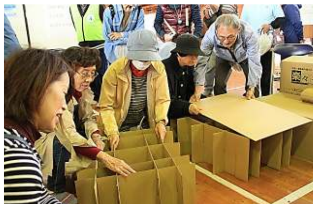
↑（左）HUG（避難所運営ゲーム）の様子 （右）ふくま防災フェスタ 2018の様子