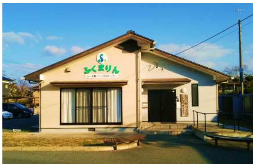
↑ 福間郷づくり交流センター（ふくまりん）