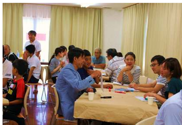
↑ (左、右) 第2回ふくま未来会議 (会場：ふくまりん) の様子