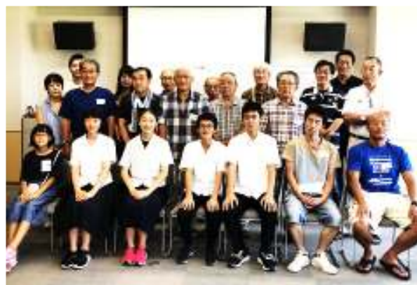
↑ (左、右) 第1回ふくま未来会議 (会場：ふくとぴあ) の様子