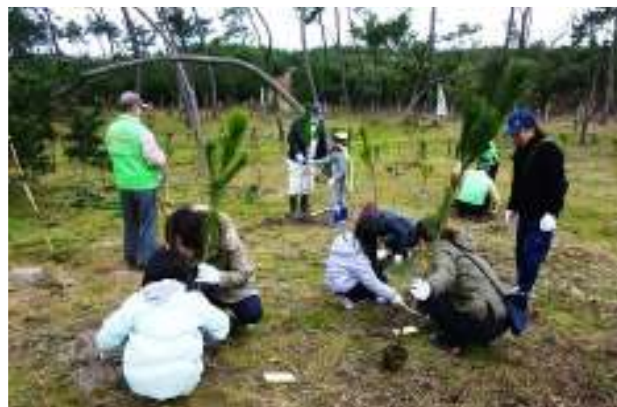
↑ (左) 松林保全活動(清掃作業)の様子 (右) 松の苗木を植える植樹祭の様子