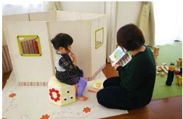
↑ (左) プレーパークの様子 (右) 子育てサロンわくわくひろばの様子