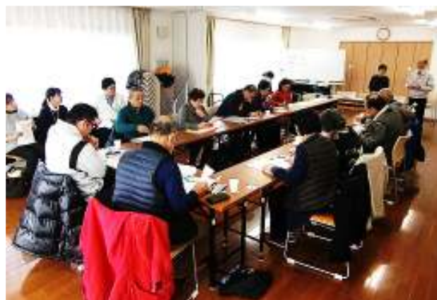
↑ (左) 転倒予防体操（てんとうむし体操）教室の様子 (右) 郷づくり・小地域福祉会・サロン連絡協議会の様子