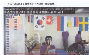
ユーチューブによる配信画像

極力抑える実施対策(※1)の中での行事運営、また、「ふれあい食事会」(高齢者と子ども)も例年とは異なり、会場を設けず、弁当とお菓子に額入りの寄せ書き(高齢者⇄子ども)を配る等、単に中止でなく、次の年へ引継ぐ大事な行事として工夫を凝らした行事運営をされておられます。