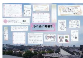
ふれあい寄せ書き

その中で、恒例の「秋祭り」をコロナ禍の中でも、安全に実施する為にと役員で話し合い、密になるのを