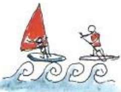
九州の湘南と 呼ばれる沖ノ島